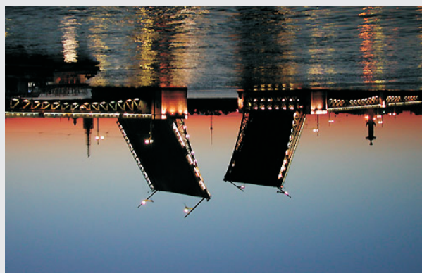
27 апреля 2007 года, Россия, Санкт-Петербург