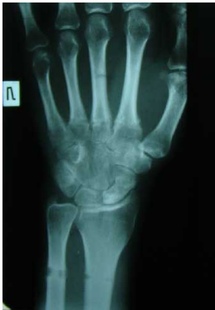
После снятия аппарата