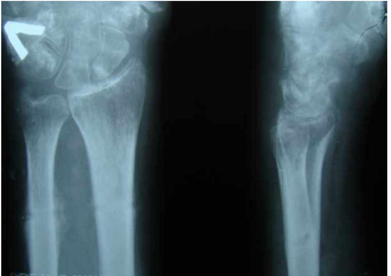
После снятия аппарата