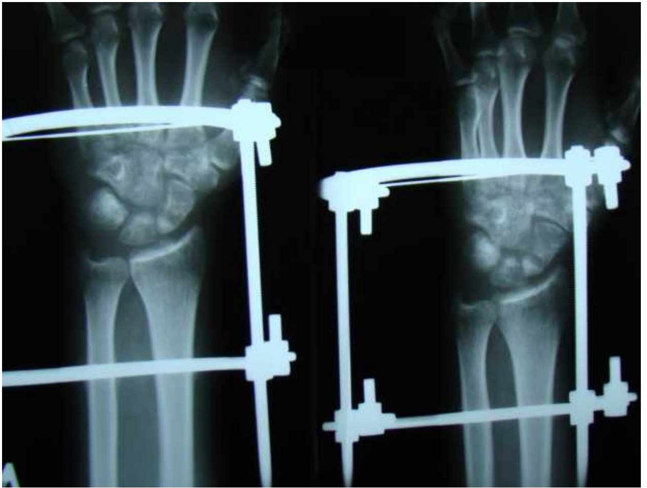
1,5 месяца в аппарате