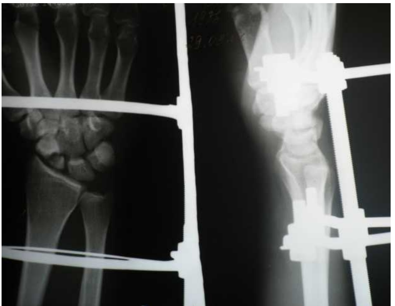
После наложения аппарата