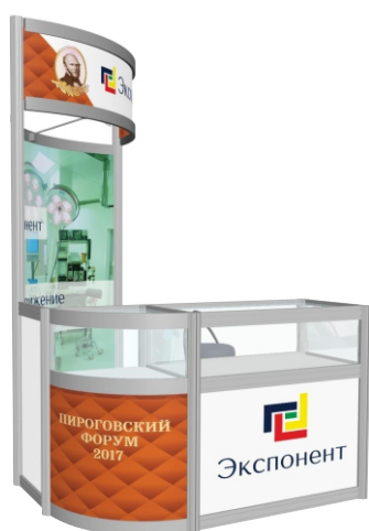
Стенд с витриной