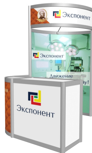
Стенд со стойкой ресепшна